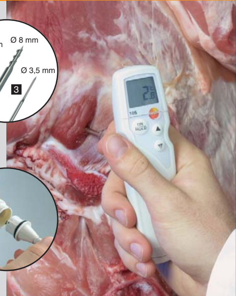
Maghőmérséklet-mérés friss hús átvételekor